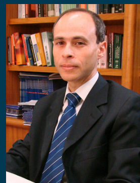
Des. fed. Sergio Schwaitzer

O carioca Sergio Schwaitzer graduou-se em Direito, em 1982, pela Universidade Cândido Mendes. Em agosto de 1988 ingressou na magistratura federal, primeiro na Seção Judiciária de São Paulo e, no mesmo ano, no Rio de Janeiro. No biênio 2000/2001 foi diretor do Foro da Seção Judiciária fluminense. Em 2001, tomou posse como desembargador do TRF2.