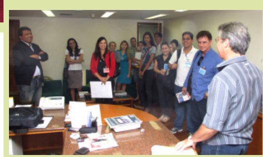
Visita ao gabinete do magistrado